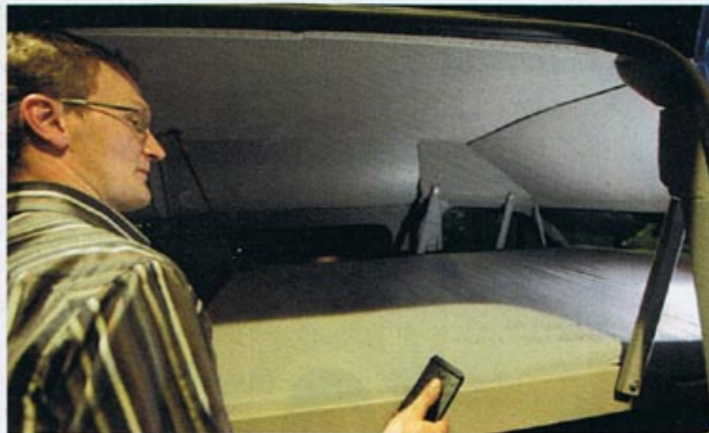
Gegen Aufpreis verfügt das zweimal 1,30 Meter große Dachbett über einen elektrischen Absenkmechanismus.