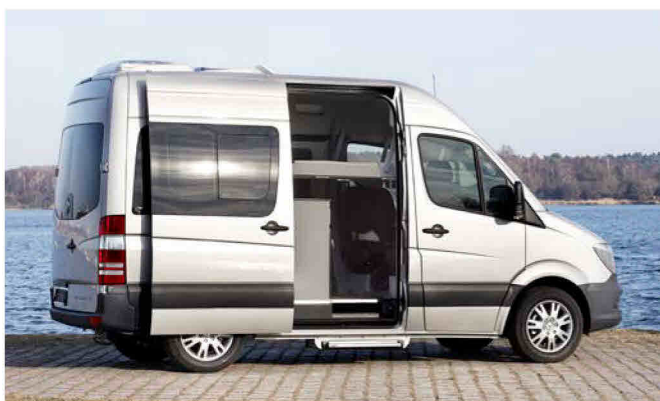
Der 520HE ist ein neuer Grundriss mit Einzel-Dachbett und Einzelheckbett.